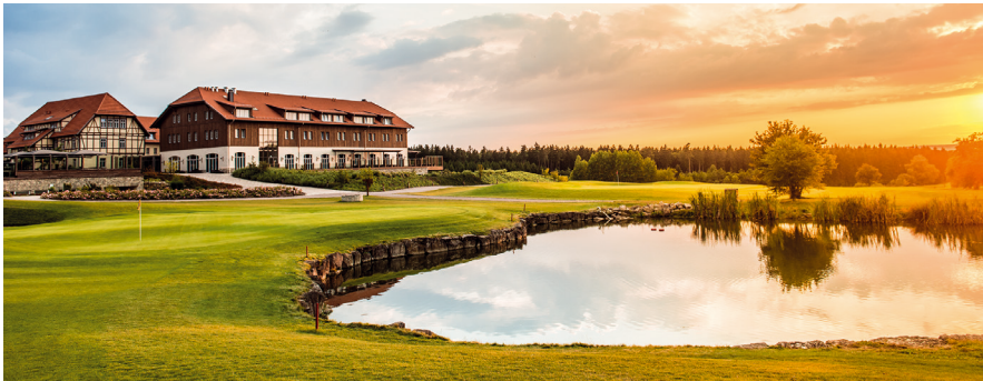
Das „Spa&GolfResort Weimarer Land“ in Blankenhain inmitten traumhafter Natur.

tet und betrieben vom Thüringer Unternehmer Matthias Grafe, verfügt über alle Angebote zur optimalen Kombination aus (Leistungs-)Sport und Wohlfühl-atmosphäre. Dazu gehören ein Sportplatz, der internationalen Anforderungen entspricht, ein Fitnessstudio, ein Wellnessbereich sowie drei Golfplätze. Ein Ausweich-Sportplatz sowie ein Medienzentrum werden mit Unterstützung des Landes und seiner LEG zusätzlich im Ort hergerichtet – damit verbunden sind Investitionen, die die touristische Attraktivität und die Stadtentwicklung Blankenhains befördern. Thüringen ist – das zeigt die EM – ein Standort mit vielen Qualitäten, und das Land tut viel, um den Freistaat noch attraktiver für Unternehmer und Touristen zu machen. (hw)