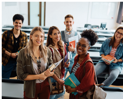
Start der vier GPS-Standorte, Bild: © Drazen Zigic / Shutterstock

Anfang März ging sie an vier Standorten in Thüringen an den Start – eine Schule, wie es sie bisher in ganz Deutschland noch nicht gab. Die German Professional School (GPS) ist eine Einrichtung, die Geflüchtete und künftig auch junge Menschen aus Drittstaaten gezielt auf eine Berufsausbildung im Freistaat vorbereitet, wobei auch die gesellschaftliche Integration im Fokus steht.