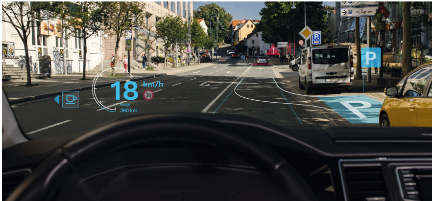
Holografische Augmented Reality Head-up Displays auf Basis der ZEISS „Multifunctional Smart Glass“ Technologie projizieren wichtige Infos, ohne dass Autofahrende den Blick von der Straße wenden müssen.

Zu den neuen Anwendungsmöglichkeiten gehören künftig Frontscheiben im Auto, auf denen Informationen eingeblendet werden – sie kann der Fahrer wahrnehmen, ohne den Blick von der Straße wenden zu müssen. Holografische Anwendungen auf Seiten- und Heckscheiben unterstützen zudem die digitale Kommunikation des Autos mit anderen Fahrzeugen – ein wichtiger Schritt hin zum autonomen Fahren. Im Wohnbereich – Stichwort Smart Home – ermöglicht die ZEISS-Technologie durch holografische Integrationselemente in Fensterscheiben völlig neue Formen der Wohnraumbelichtung. (hw)